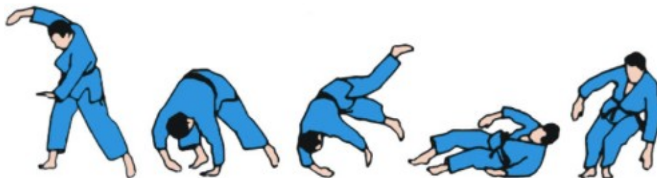
ZEMPO-KAITEN-UKEMI (Caída rodando hacia adelante).