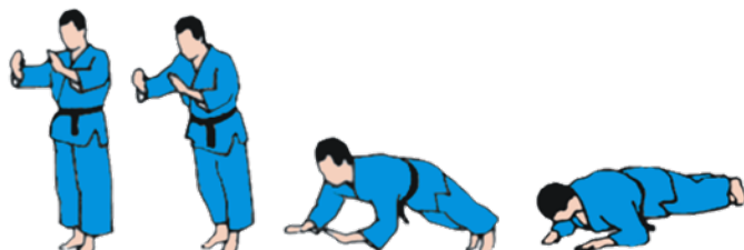
MAE-UKEMI (Caída frontal).